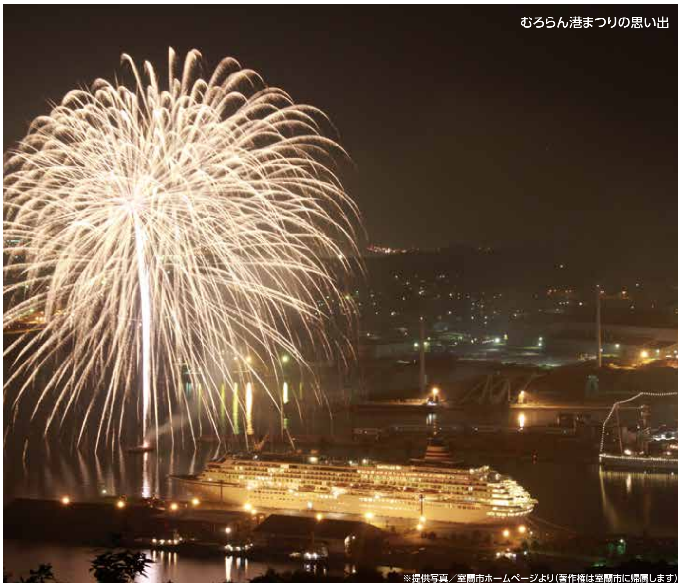
むろらん港まつりの思い出