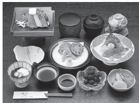
ご利用の際は前日までにご予約をお願いします。