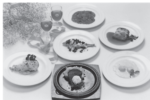
写真はイメージです。 ご利用の際は前日までにご予約をお願いします。