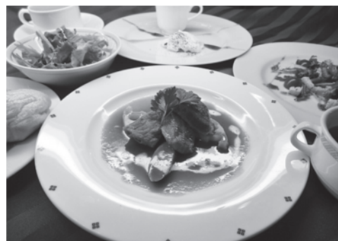
写真はイメージです。 ご利用の際は前日までにご予約をお願いします。