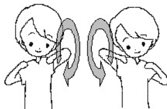
肩に手を当ててひじを回す