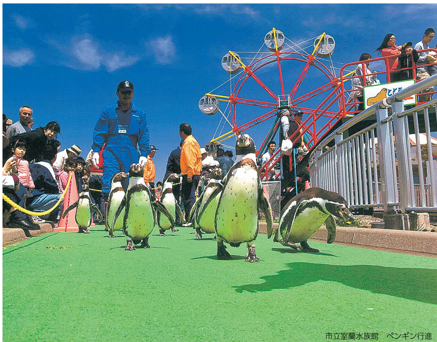
市立室蘭水族館 ペンギン行進